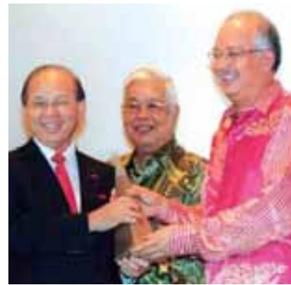
Tan Sri Dato' Azman Hashim (kiri) menerima anugerah "Merit Khas untuk Pengurus Utama Terbaik Malaysia 2004 (Pasaran Korporat Sukuk) Rating Agency Malaysia (RAM) daripada Timbalan Perdana Menteri, YB Datuk Seri Najib Abdul Razak (kanan).

Di dalam bidang pasaran modal hutang pula, Kumpulan telah menerima lima Anugerah Liga RAM daripada Rating Agency Malaysia (RAM) untuk kejayaan kami dalam Pasaran Korporat Sukuk dan kategori Pengurus Utama untuk urus niaga Islam dan konvensional berdasarkan jumlah urus niaga yang disempurnakan serta nilai terbitan. Kumpulan juga telah mendahului Jadual Liga 2005 Malaysian Rating Corporation mengikut jumlah terbitan dan berada di kedudukan tangga kedua berdasarkan nilai.